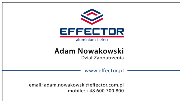
Wizytówka strona imienna

Wizytówka pozostaje w pełnej i jednoznacznej spójności z pozostałymi kanałami komunikacji wizualnej. Dane przedstawione są w sposób jasny i czytelny. Na spójność systemu składa się: logo pozycjonowane w górnej części.